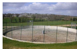
Fosse à lisier