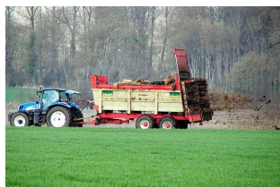
Epandage de fumier