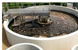
Boues station d'épuration