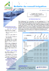
Bulletin d'avertissement irrigation (Chambre d'Agriculture)