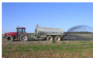
Epandage de lisier ou de boues